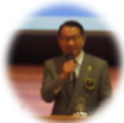
【白鳥敬日瑚ガバナー】