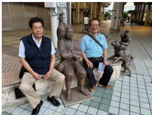
高岡駅近くの桃太郎像