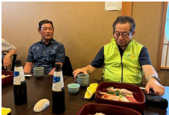
七尾みなと RC の皆様と懇談