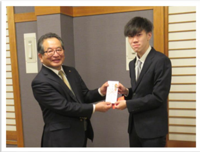
【小穴会長からヤンさんへ奨学金 贈呈】