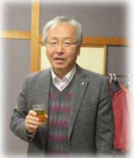
【司会：三原親睦活動委員長】 【乾杯：赤羽副会長】