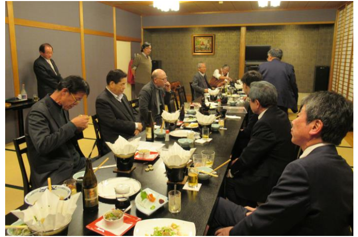
【締め：場々ガバナー補佐】