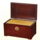
【場々ニコニコ出席副委員長】