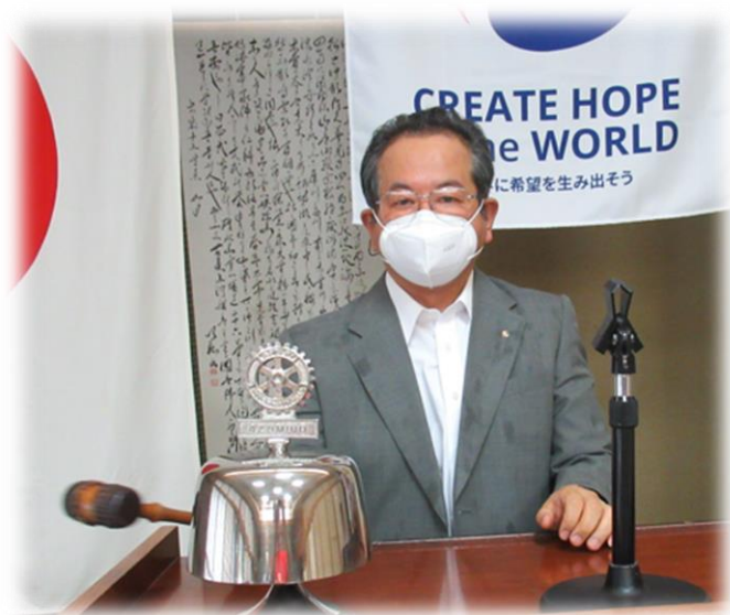
【 小穴会長 点鐘 】