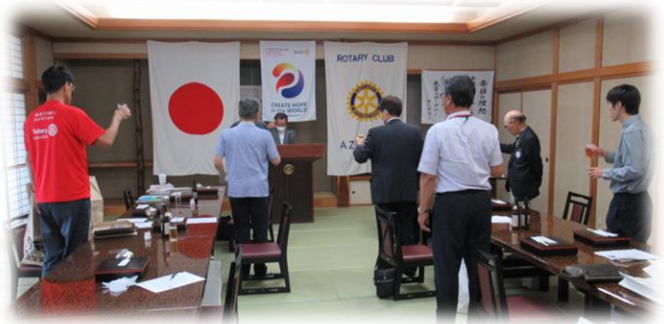
【 月初め 乾杯 】